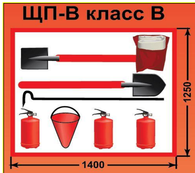
ЩП-В – щит пожарный для очагов пожара класса В