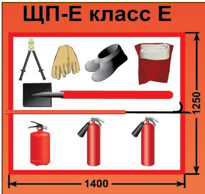
ЩП-Е – щит пожарный для очагов пожара класса Е