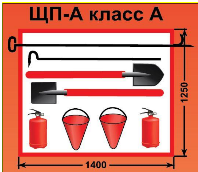
ЩП-А – щит пожарный для очагов пожара класса А