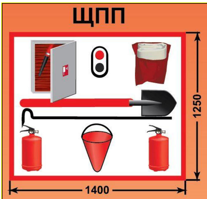
ЩПП – щит пожарный передвижной